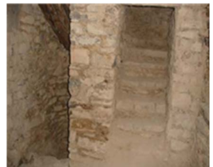
Début de reconstruction.

Les travaux de démolition sont maintenant terminés. La reconstruction s'amorce.