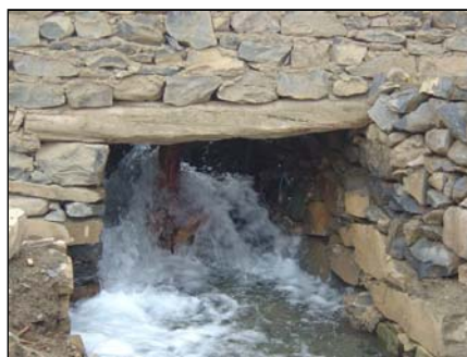
La roue à aubes